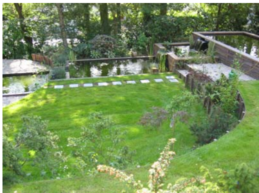
Bassins, cascades, piscine écologique et plantations: un espace de quiétude et de repos.