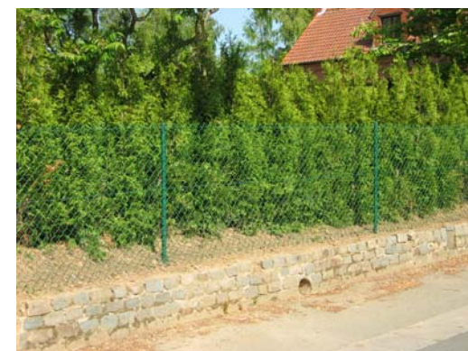
Haie et clôture : chez soi, en sécurité.