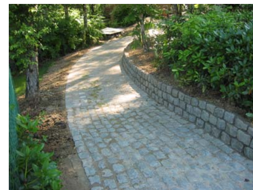
Piétonnier et muret en vieux pavés de rue.