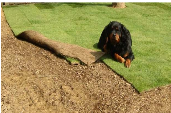
Gazon en rouleaux : quel confort!

Central Jardin SA c'est aussi un bureau d'architecture de jardin. Vous désirez aménager votre jardin sans risque de vous tromper? Demandez un rendez-vous avec l'un de nos architectes de jardin. Il vous renseignera sur les modalités et conditions de ce service.