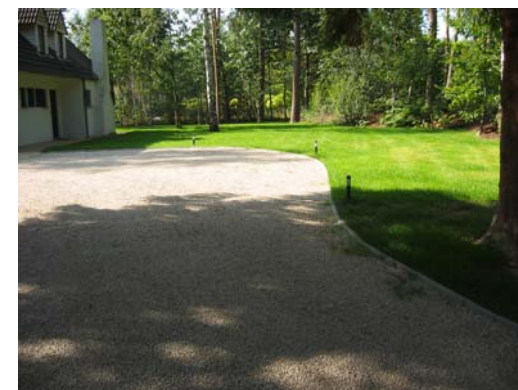
Entrée et parking privé en dolomies : la classe!

110 Rue de l'institut 1331 Rosières Téléphone : 02/ 653.54.78 Fax : 02/ 652.06.78 Messagerie : info@central-jardin.be Succursale: 305 chaussée de Wavre 1390 Grez Doiceau Tel 010/ 840553