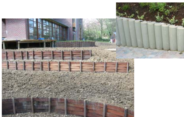
Soutiens de terre en claie d'azobé et en rondins de béton.

CENTRAL JARDIN S.A. C'est aussi une pépinière et deux centres de jardinage où vous trouverez tout pour créer, embellir et entretenir votre jardin.